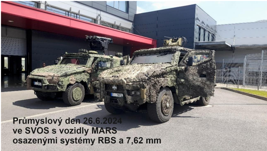
Průmyslový den 26.6.2024 ve SVOS s vozidly MARS osazenými systémy RBS a 7,62 mm