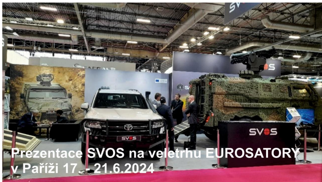
Prezentace SVOS na veletrhu EUROSAFORY v Paříži 17. - 21.6.2024

MARS 4x4. Jeden se systémem RBS od švédské společnosti SAAB a druhý se střeleckou dálkově ovládanou věží MANTIS 12,7 mm od české firmy EVPÚ Defence. V expozici SVOS také velice upoutávalo pozornost celopancéřované provedení Toyota LC 300.