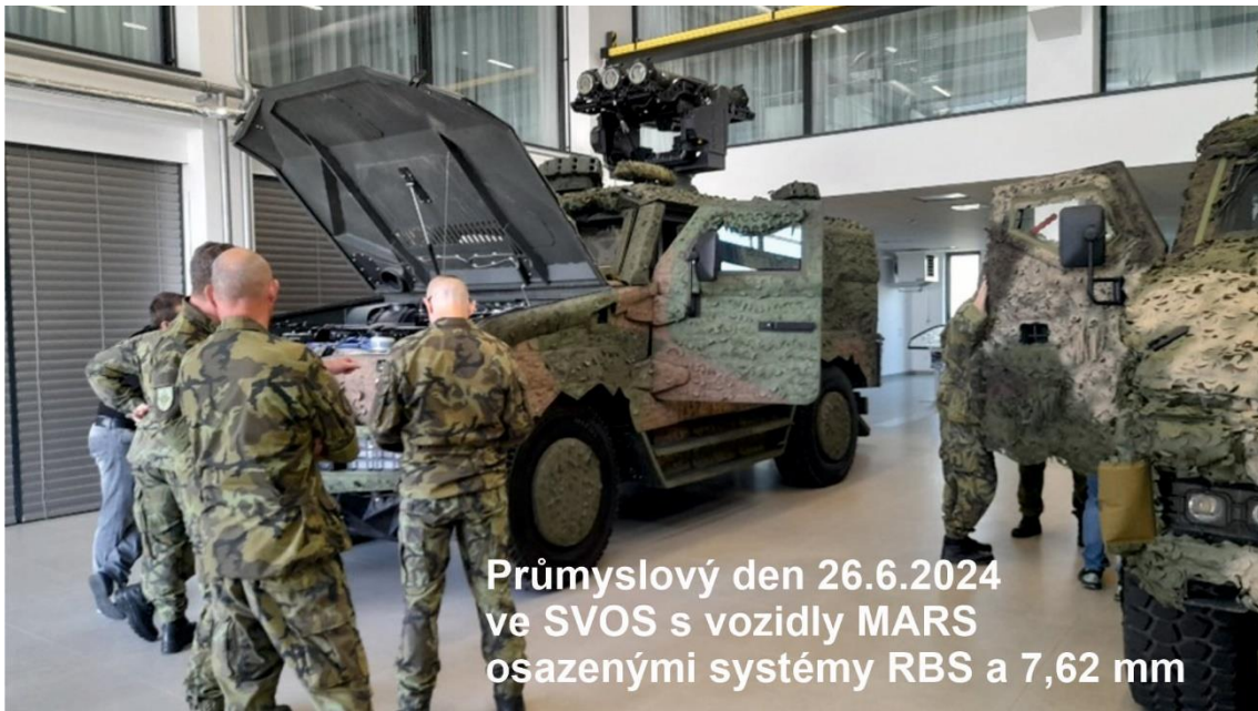
Průmyslový den 26.6.2024 ve SVOS s vozidly MARS osazenými systémy RBS a 7,62 mm