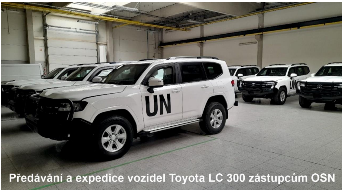
Předávání a expedice vozidel Toyota LC 300 zástupcům OSN

Společnost SVOS se v roce 2024 prezentovala také na mezinárodních veletrzích a průmyslových dnech v Saúdské Arábii , ve Francii , v Litvě , v Dánsku , na Slovensku , v Malajsii , i na Filipínách .