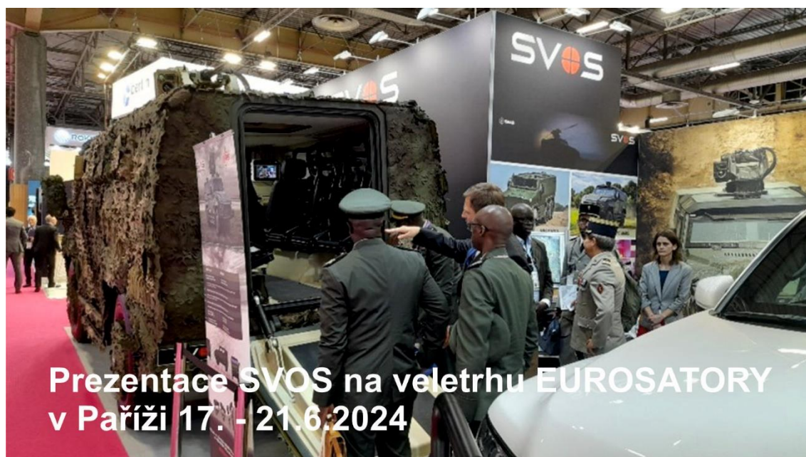
Prezentace SVOS na veletrhu EUROSAFORY v Paříži 17. - 21.6.2024

V roce 2024 se ve SVOS konal další Průmyslový den, tentokrát na téma „Bojová vozidla MARS“. Den připravila hostitelská firma v úzké součinnosti se Sekcí průmyslové spolupráce MO ČR. Mezi účastníky Průmyslového dne byli zástupci různých útvarů a složek Armády ČR. Hosté měli v průběhu Průmyslového možnost detailně si prohlédnout tři verze tohoto vozidla: MARS 4x4 s RBS 70 NG, MARS 4x4 se střeleckou dálkově ovládanou věží GLADIUS 12,7 mm a MARS 4x4 Double Cabine se střeleckou věží GLADIUS MINI 7,62 mm.