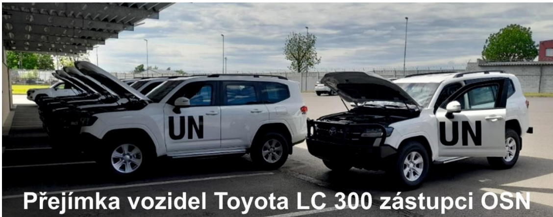
Přejímka vozidel Toyota LC 300 zástupci OSN

Po náročných a všestranných testech se naplno rozjela výroba celopancéřovaného automobilu Toyota LC 300 . Mezi zákazníky, kteří si převzali tyto vozy, dominovala především Organizace spojených národů , ale cestu si našly i k jiným významným klientům.