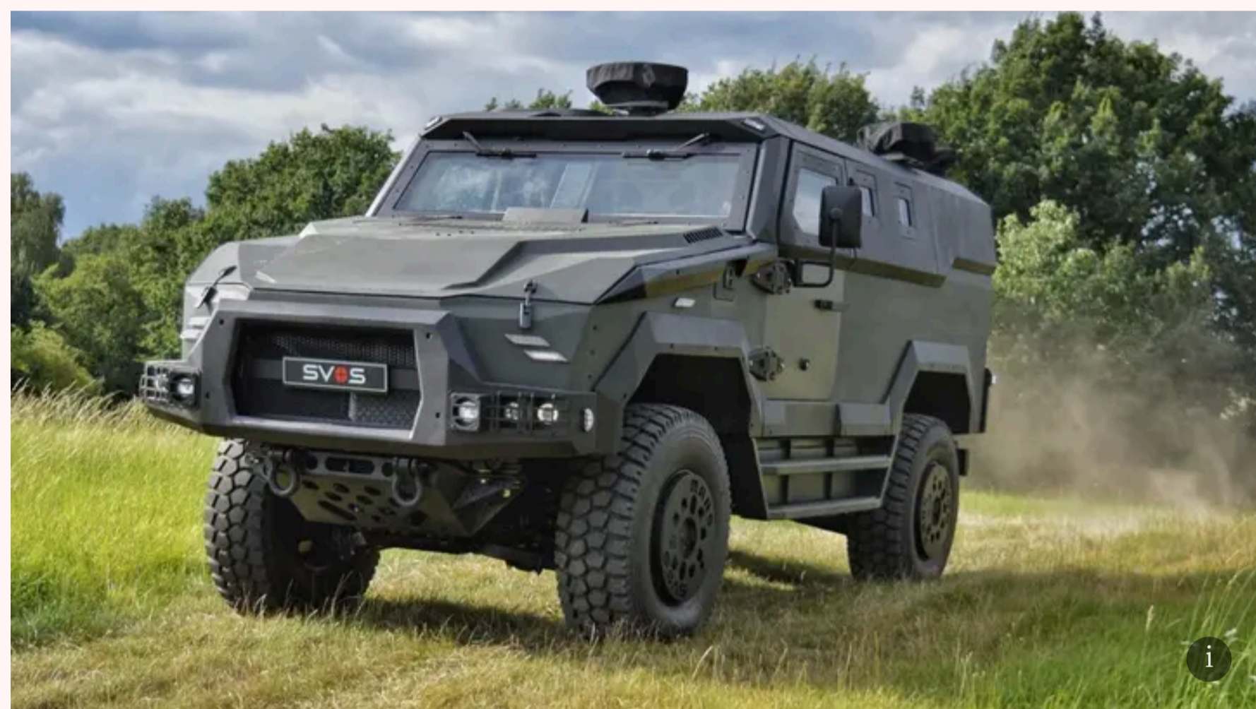
Bojový vůz MARS od společnosti SVOS Přelouč.