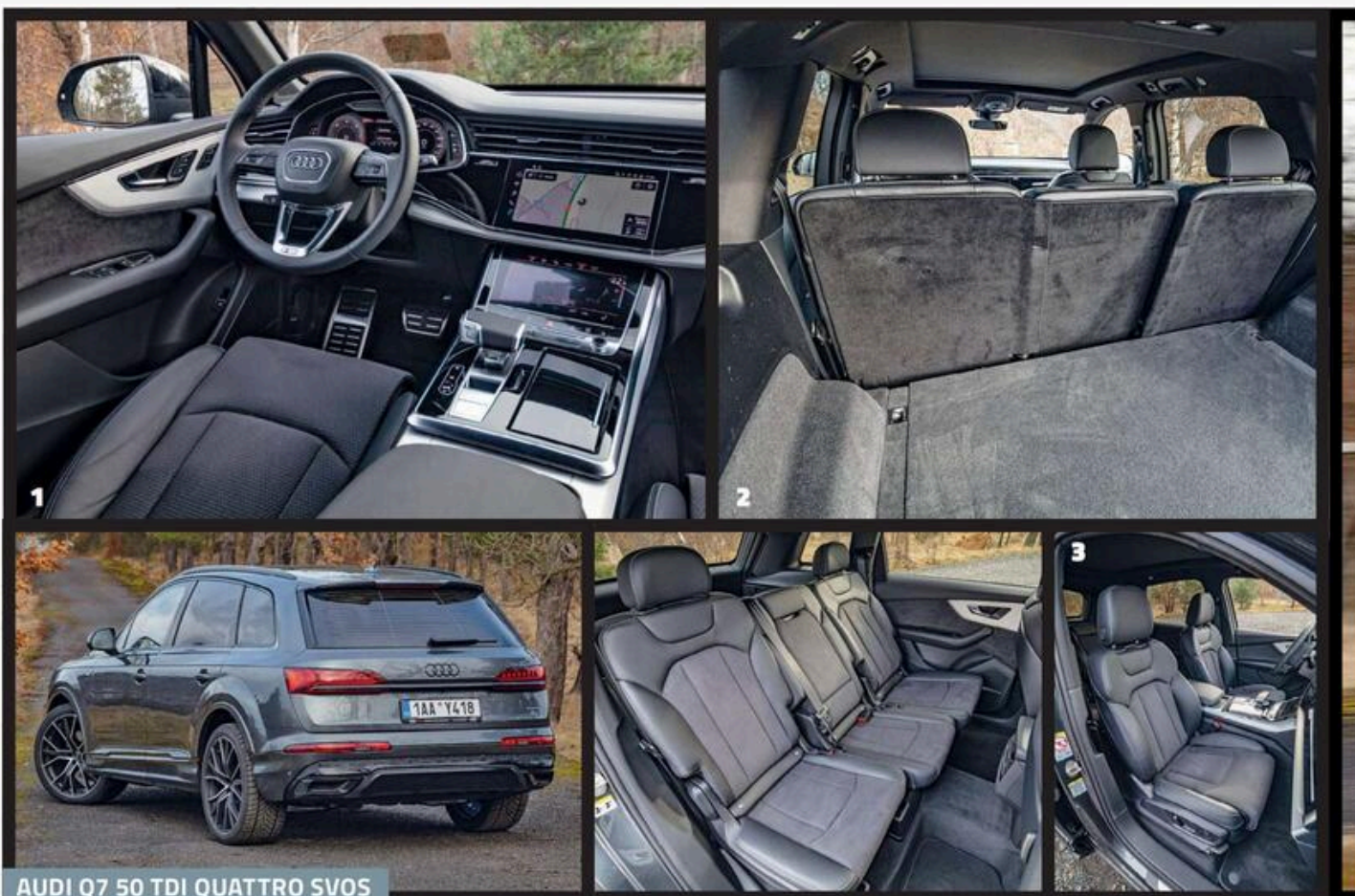
AUDI Q7 50 TDI QUATTRO SVOS