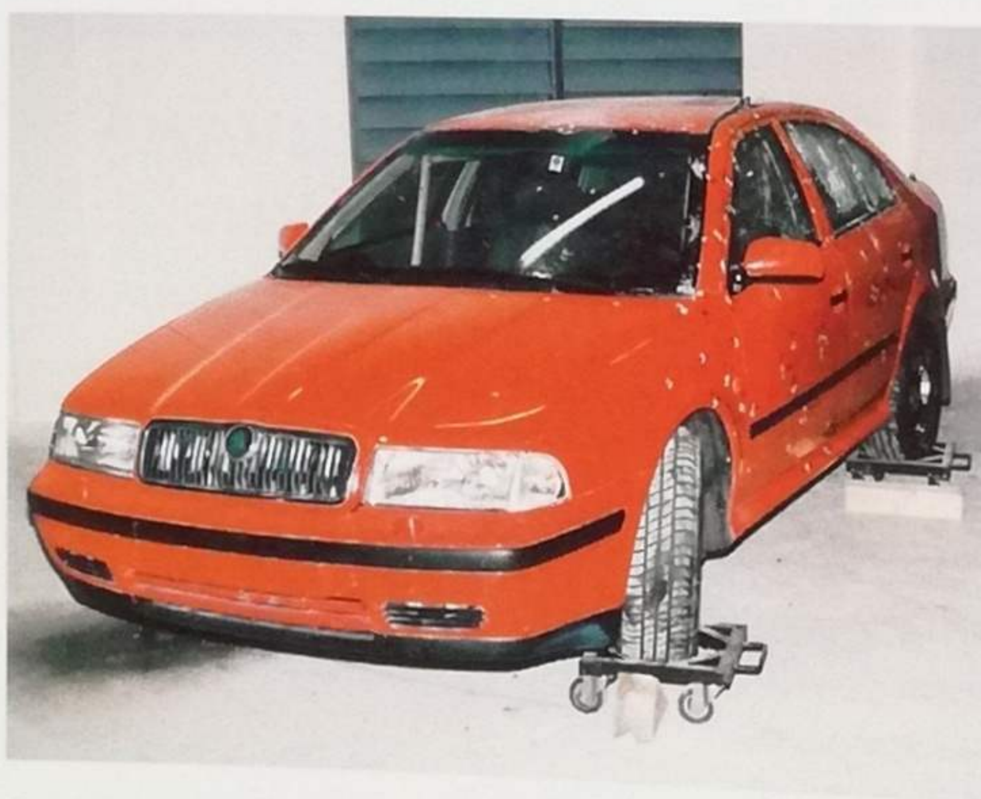
Prototyp pancéřovaného vozu Octavia při balistických zkouškách ve Slavičíně

Automobilka v tiskové zprávě i v rusky psaném prospektu rozdáváném na moskevském autosalonu nabízela řadu prvků mimořádné výbavy, včetně speciální ochrany podlahy proti granátovým střepinám nebo pěchotním minám, balistickou ochranu palivové nádrže i speciální protipožární ochranu kabiny a motorového prostoru.