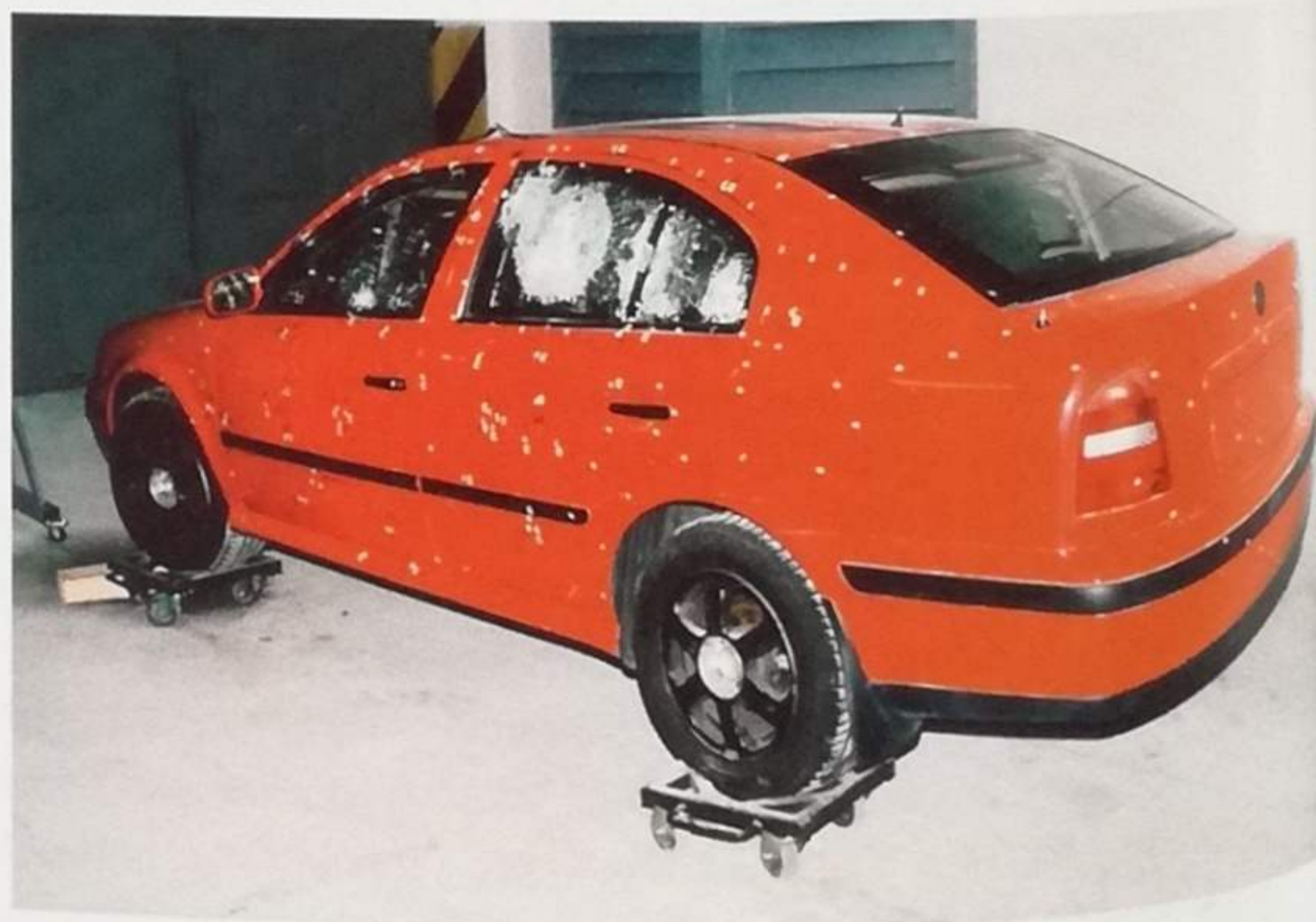
Na vůz při zkouškách vystříleli na 150 projektilů, úspěšnost ochrany byla 98 %