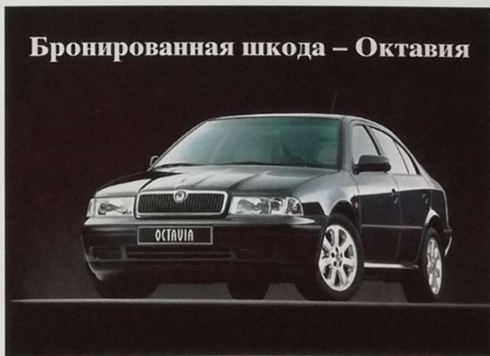
Prospekt pancéřovaného vozu Škoda Octavia pro moskevský autosalon 1999

Škoda Auto projekt v roce 2001 ukončila, společnost SVOS Přelouč v něm pokračovala ještě další dva roky. Podle záznamů z archivu SVOS bylo v letech 1998 až 2003 zhotoveno celkem šest pancéřovaných vozů Octavia s karoserií liftback a přeplňovaným zážehovým čtyřválcem 1.8 20V Turbo o výkonu 150 k (110 kW) a také dva pancéřované automobily Octavia Combi poháněné turbodieselem 1.9 TDI o výkonu 110 k (81 kW).