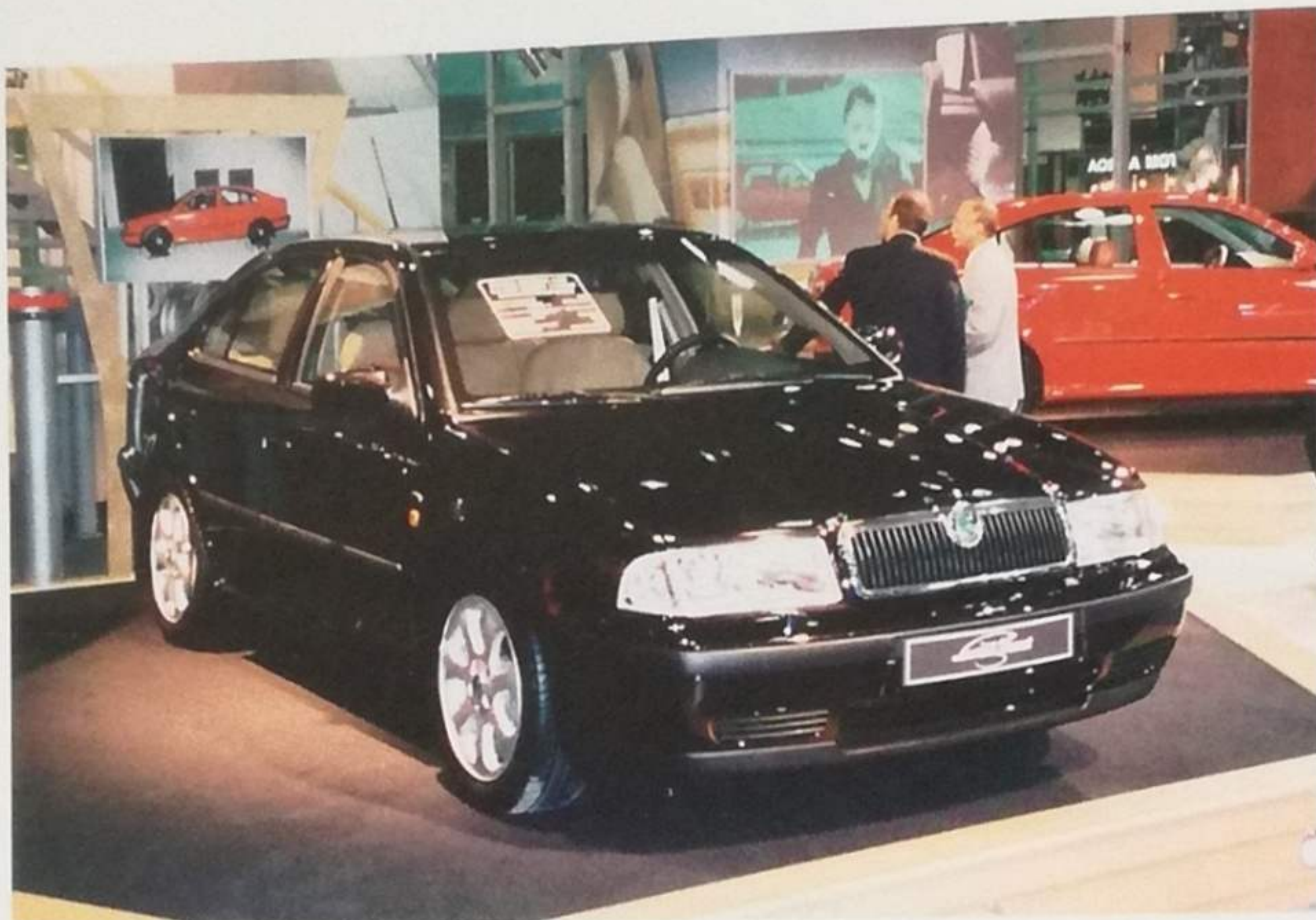
Pancéřovaná Octavia Laurin a Klement při premiéře v srpnu 1999 v Moskvě

Hmotnost vozu vzrostla asi o 230 kg, takže musel být zesílen podvozek, zejména pružiny a tlumiče. S přeplňovaným zážehovým motorem 1.8 20V Turbo o výkonu 150 k (110 kW) a pětistupňovou manuální převodovkou dokázala pancéřovaná Octavia vyvinout rychlost kolem 210 km/h. Alternativně mohl být vůz poháněn i turbodieselem 1.9 TDI o výkonu 110 k (81 kW), přičemž oba motory mohly být kombinovány s manuální i s automatickou převodovkou.